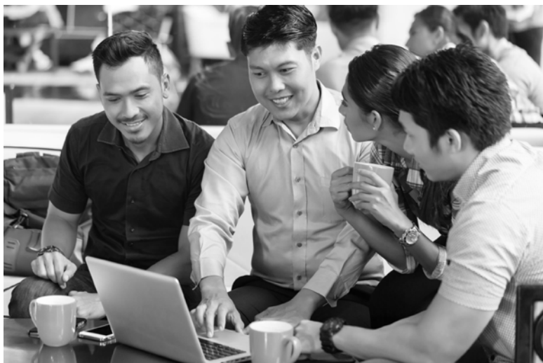
▲具備日檢N2或TOEIC 600分以上求職者，爭取進入日企工作可能更有勝算。

各大金控業者搶人才，過往招募資訊多針對 MA 儲備人才設定具備 TOEIC 750 至 850 分不等的英語力，而今不只期望人才具備英語力，更鎖定資訊相關人才為企業招募新血。可以想見未來跨領域金融國際人才將會是產業競爭的決戰主力。