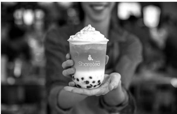
▲ 這杯歇腳亭珍奶，美國人願意排隊40分鐘來買。

雖然台灣門市不多，但早在政府喊出新南向之前，歇腳亭就深耕港澳及馬來西亞、菲律賓、新加坡等新南向國家，也在北美、歐洲積極展店。無論是在悠閒放鬆的菲律賓長灘島，抑或是步調緊湊的美國矽谷、香港街頭，都可以隨時來一杯歇腳亭出品的道地台灣珍珠奶茶。