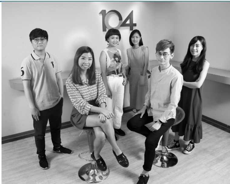
▲ 104 鼓勵人才追求創新、具備跨領域整合能力，同時重視員工加強英語力。

現，針對不同類型的人才，制訂不同的職涯發展計畫。「若是具有主管潛力的人才，就會希望他們加強英語能力，未來才有能耐帶領其他員工走得更遠。」