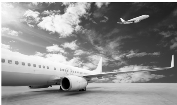
▲ 求職者嚮往航空產業，每到招募季節總吸引眾多報名者。

無獨有偶，由前長榮航空董事長張國煒成立的星宇航空，雖目標於 2020 年正式飛航，也在今年六月公布「培訓飛航員招募計畫」，英