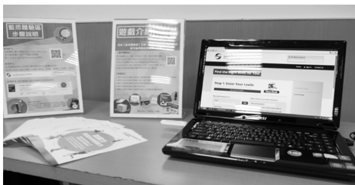
▲ 只要上藍思圖書館網站，就能輕鬆查詢英語讀本的閱讀指數，挑選適合的教材。（網站請見： https://fab.lexile.com/ ）

Instagram 的標籤「#bucketlist」作為主題，學生須從這個標籤搜尋自己喜歡的貼文，再上台說明選擇的原因；其他學生也能透過自己的手機找到同一則貼文。